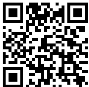
临时休息区（12 号教学楼）