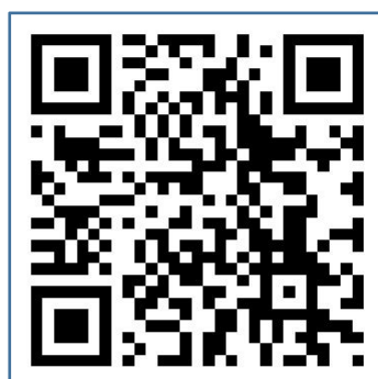
考生进校入口：湖南理工学院南院东 1 门